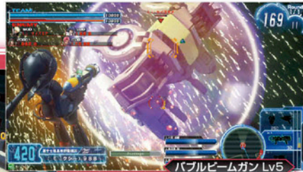
弾数は2発と少ないが、射撃で当たれば300以上のダメージも！ ▲パブル状態を解除するまでの時間が長くなっているため、妨害力がアップ！