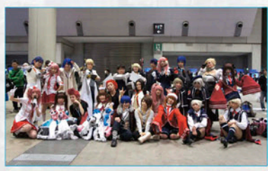
▲大会前日の公式オフ会では多くのコスプレイヤーが会場に! あべくんが必死に撮って撮った写真がコレ。

大会前日は公式オフ会として会場フリープレイが楽しめたり、物販コーナーがあったりしたスよな。あと前日エントリーの抽選会とかもあったんだっけ。 そうそう。で、翌日の大会は1日で予選から決勝まで行ったというね。今考えてもすごいスケジュールだ(汗)。