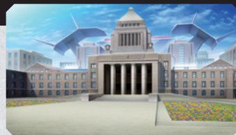
▲「ながた」内の国会議事堂。ここで議会が行われる。

なお、彼女らは国会議員の資格はなく、大統領権限によって任命された専任の特命大臣になる。また彼女らは「リベレイターズ」と呼称され、この名称は彼女らが最高ランクの解放能力を持つリベレイターであることから付けられた。