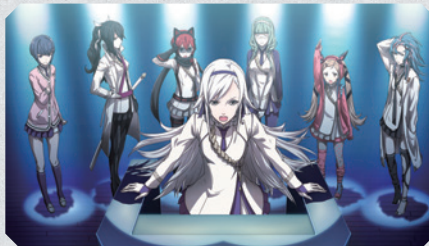
▲第二次大空翔子内閣の大臣の半数は、高い解放力を持った10代の少女たち。有事の際は彼女らが先陣を切って戦う。