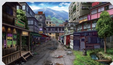
▲ノーカラーと呼ばれる人たちのほとんどは、避難民居住地区であるロマンティック・スラムに住んでいる。

新日本国建国の第一歩を踏み出すことになった「大空翼一郎の乱」。その発端となった軽井沢が、現時点では政令で新日本国の暫定首都とされている。軽井沢中央部には立法府や行政府、軍事研究や開発施設など、国家の中枢機関を要する巨大都市戦艦「ながた」が停泊（現在も大国とは交戦状態にあるため、常に出撃可能状態を維持している）。そこから放射状に、居住・商業などの各エリアや避難民の避難エリアが広がっている。ただし、かつての日本国憲法にあった「法の下の平等」という原則はなくなり、新日本国の国民は、バイオレットをはじめとした3つの種別に大別されることとなる。