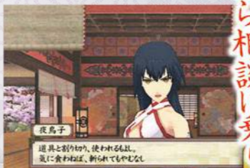
▲強い覚悟を持っている夜鳥子。彼女は、一族の頼もしい味方になってくれるのだ。

天変地異を鎮める人柱として、皆殺しにされた主人公一族の復讐を描いたRPG「俺の屍を越えてゆけ2」。今回は物語のカギを握る2人の登場キャラクターが判明した。また個性豊かな新登場の神様や、迷宮での戦闘など気になる続報も紹介していく。