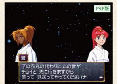
子の赤丸の代わりに、この夜がチヨイと先に行きますから笑って見送ってやってください

前作の反魂の儀は親や祖父母よりも先に子どもが死んでしまったときに、直系の血族が犠牲になり子どもの魂を呼び戻す儀式でした。切ないので、可能ならば見たくないイベント。この儀式で亡くなったはずの夜鳥子が、転生するってどういことでしょうか？ (ライター長雨)