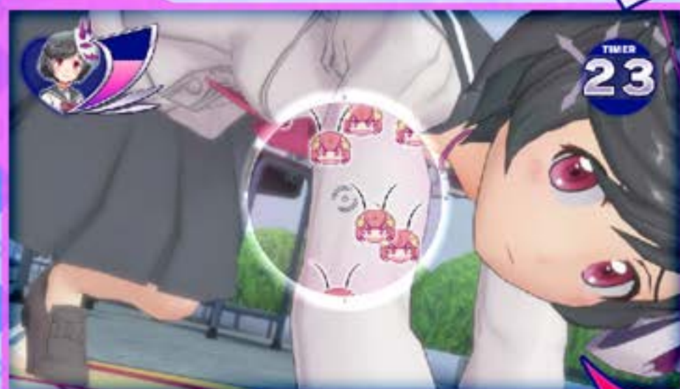
マーカーショットフェーズ