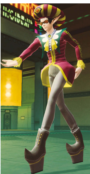
フォニューム・レブカ+フォニュームハット+フォニュームグラス

▲▲フォニュームハットなどのアクセサリは、ほかのコスチュームと組み合わせるのもアリ。自由に楽しもう。