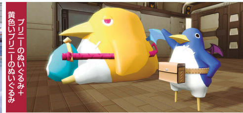
黄色いプリニーのぬいぐるみ+プリニーのぬいぐるみ+