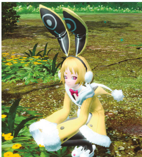
ウサリア・レпка+ウサリアショートヘア