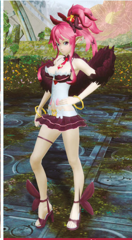
セラフィヌ・レпка+セラフィヌボニーテール