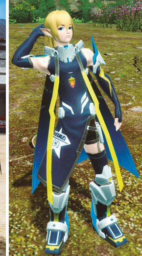
エクスウィランツ