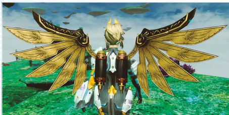
アンティークウィング