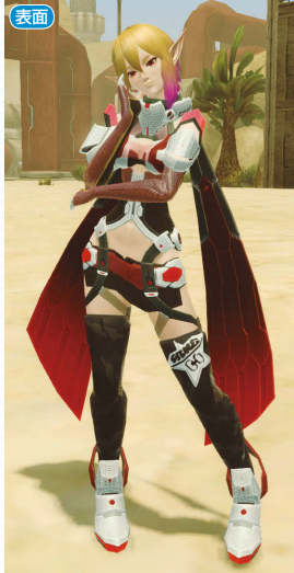
クリムピアシオ+ユクリータショート