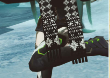
ノルディックマフラー