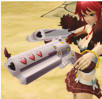
*絢爛砲ブリュンヒルデ (武器迷彩/双銃銃)

ムや髪型を中心に、さまざまなアイテムが配信される。さらには浅井真紀氏デザインのパーツ、新しくなったアフィンやユクリータのコスチュームも!!