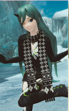
ノルディックマフラー