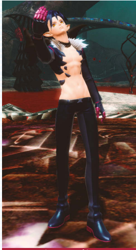
キリア・レпка+キリアスパイクヘア