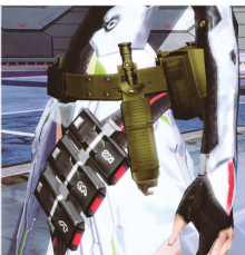
ミリタリーベルト