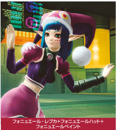
フォニューール・レブカ+フォニューールハット+フォニューールペイント

複数回に渡って追加されてきた『PSO』コスチューム。ハンターズのトリを飾るのはフォニュームとフォニューールだ。帽子などは別アイテムなので、『PSO2』のコスチュームと合わせる手もあり。