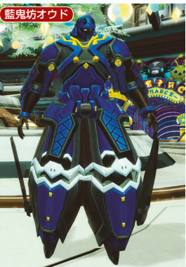
▲藍鬼姫シキと藍鬼坊オウドは袴のようなレグが特徴だ。ちなみに、2人のパーツはACスクラッチアイテムとして同時配信されるのでそちらにも注目しよう。