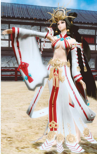
天原日姫衣+天原日姫髪+天原日姫冠