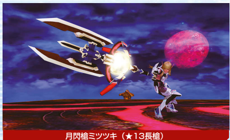
月間槍ミツツキ (★13長槍)

昨年の秋に配信された期間限定緊急クエスト「禍魂集いし戦道」が、2016年バージョンになって再登場。黒ノ領域が舞台のクエストで、今年は出現するエネミーが一部変更されている。注目は禍夜獣ガル・グリフォン。通常とは異なる二つ名を持ち、パワーアップしているだけでなく、新たな★13武器をドロップする。クエストの最後で必ず出現するので、レア武器ゲットの期待も大きい!