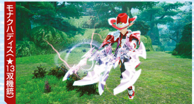
モナクハリス (★13双銃銃)