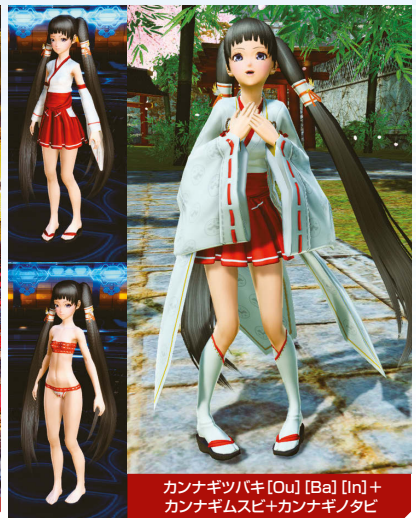
カナギバキ [Ou] [Ba] [In] + カナギムスビ+カナギノタビ