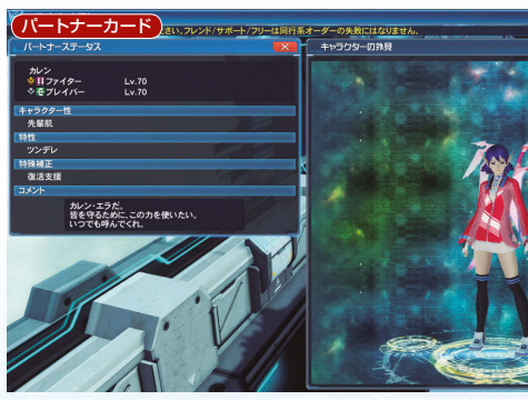
▲クレアダブルスとダガーオブセラフィは2人の武器としておなじみだが、じつは『PSU』のストーリーのなかでは一度も使われたことがない。NPCとして呼び出したときに装備していた武器だ。