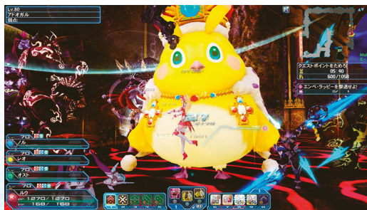
▲エンベ・ラッピーも登場。新世武器の強化素材が手に入りやすい。

▲ルーナ・ニヤウがドロップする新★13武器。満月をモチーフにした和風デザインで見た目がとてもカッコイイ。