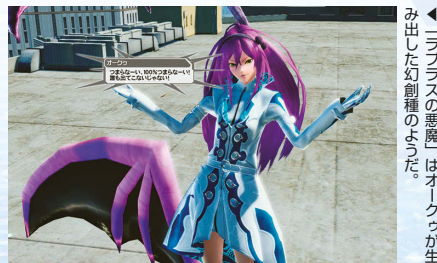
マクスウェルの悪魔

▲サブストーリーではヒューイがEP4初登場。髪の毛が伸び、コスチュームが新しくなっている。