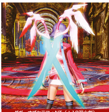
▲新世武器として再登場。旧式武器とは異なり、フオンカラーの変更に対応している。