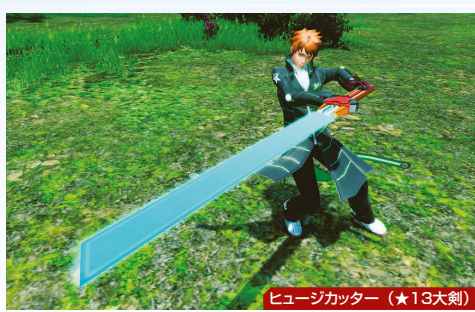
◀◀★13武器はクライアントオーダーを進めると入手可能。ヒュージカッターは「イルミナスの野望」でイーサンが使っていた武器だ。