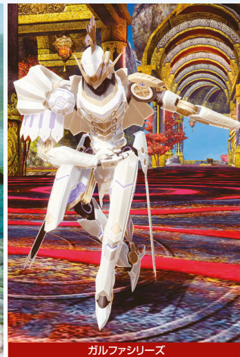
ガルファンシリーズ