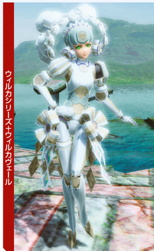
ウルカシリーズエンフルカヴェール

メッシュアップドレス [Ba] 土目隠しエネミー メッシュアップドレス [Ba] 土目隠しエネミー メッシュアップドレス [Ba] 土目隠しエネミー