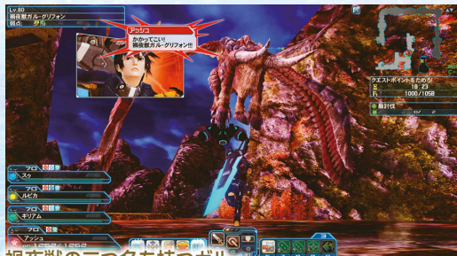
禍夜獣の三つ名を持つガル・グリフォンが待ち受ける!