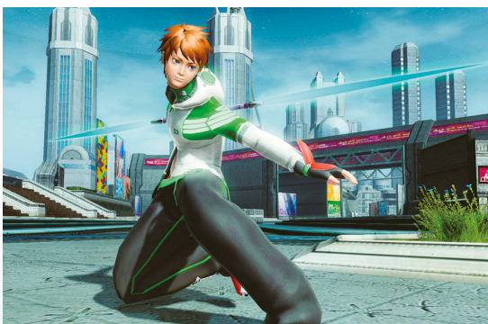
▲クレアダブルスとダガーオブセラフィは2人の武器としておなじみだが、じつは『PSU』のストーリーのなかでは一度も使われたことがない。NPCとして呼び出したときに装備していた武器だ。