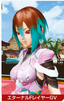
エターナルフレイヤーGV