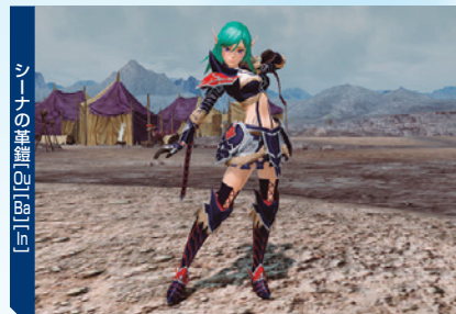
シーナの鎧 [01] [02] [03] [04]