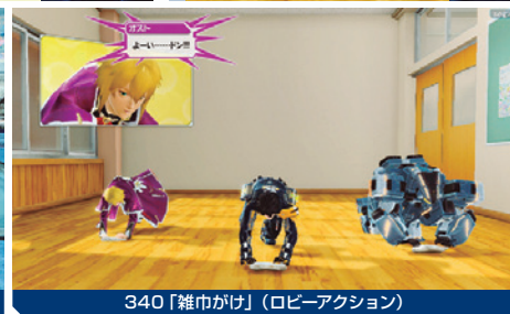
340「雑巾がけ」(ロビーアクション)