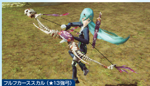
フルフカースカル(★13強弓)