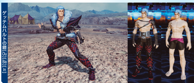
ゲットムハルトの鎧 [01] [02] [03] [04]

9月20日の配信は、ゲットムハルトやメルフォンシーナの服装、ヴェルン皇国の民族衣装などが登場。魔道国イベントとは一味違ったデザインに注目だ。翌週の9月27日には、「進撃の巨人」のコラボアイテムが配信。こちらは過去に配信されたコラボアイテムのリバイバルに加えて、「超大型巨人スーツ」などの新作もあり!