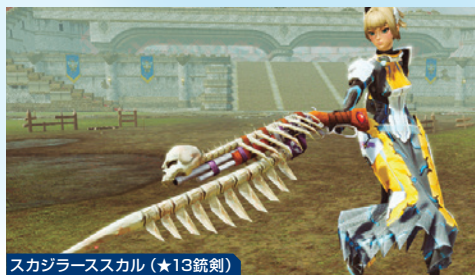
スカジラースカル(★13銃剣)