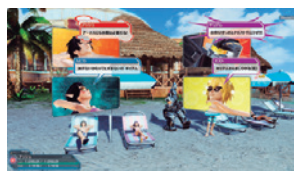
▲クラスが変えられるなど、さらに多機能になってくれるとありがたいです!

固定を組むときなど、どこかに集まることって多いですね。ということで、集合場所にかんしてアンケートをとりましたが、フランカ's カフェが圧勝! 全体の約70%以上が票を投じました。広いうえに、各種カウンターがあり、季節ごとに見た目も変わる。まさに最適な待ち合わせ場所! ちなみに、赤青対決は青部屋がダブルスコアで制しました。こんなに赤と青で差がついたのは、意外な結果!