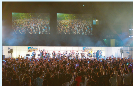
▲決勝会場は約12,000人ものアークスが会場に集結! 1つのゲームのイベントで、ここまで人が集まるってほんとスゴイことです。

なる(笑)。 レトロ :さて、今回で4回目の実施となったアンケートですが、コアなアークスのなかではこのアンケートが恒例となってきていたのがうれしかったね! 野良 :あたしたちを見つけて声をかけてくれるのは、いつもながらありがたいンヤ! ユウヒ :電撃PSchで配信を見てくれているみんなにアンケートを書いてもらったり、お話しできたのもうれしかったわ。 レトロ :なんだかんだ、僕らも楽しませてもらった3カ月でした。次回もまたよろしくね!