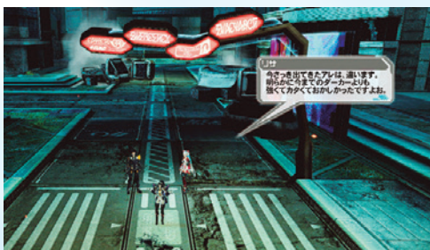
◀市街地に現れたダーカーに主人公とマトイですら苦戦。オラクルでいったい何が起きているのか?!

メインクエストは2章：パート2が配信 さらにオムニバスクエスト：EPISODE2も!! 「メインクエスト2章：Part.2」と「オムニバスクエスト：EPISODE2」が配信。メインクエストでは、ダーカーの市街地襲来に主人公とマトイも出撃するが、思わぬ苦戦を強いられることに。気になる内容はストーリーを見てのお楽しみだ。「オムニバスクエスト：EPISODE2」は、EP2のストーリーを再構成。EP1で配信されたゲットムハルトとメルフォンシーナにかかわる物語の一部も含まれるので、要チェックだ。