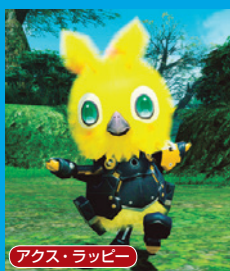
アクス・ラッピー

10月2日から期間限定ラッピーに新種が追加。アクス・ラッピーは、毎月2日に開催される「PSO2の日」限定のレアエネミーだ。フィーバー系の特殊能力が付いた装備でドロップするのが特徴。詳細は不明だが、特殊能力の効果は既存のフィーバー系よりも優秀とのことなので期待しよう。