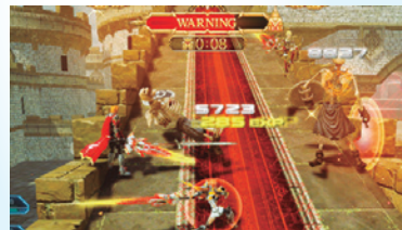
◀▲いつもとは強さの異なるスカル系エネミーが大量発生! 従来の攻略法では通用しないかも!?