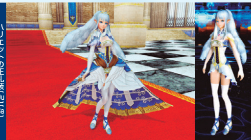
ドレス [01] [02] [03] [04]