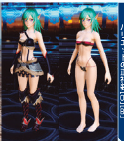
ハルトのビキニ [01] [02] [03] [04]