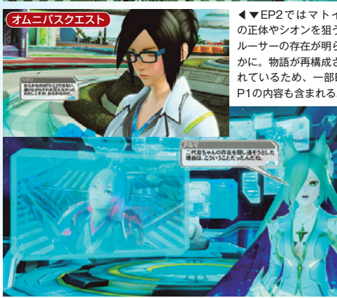
オムニバスクエスト ◀EP2ではマトイの正体やシオンを狙うルーサーの存在が明らかに。物語が再構成されているため、一部EP1の内容も含まれる。