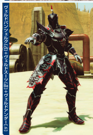
ヴェルトハンツヘルム+ヴェルトドロー+ヴェルトアーマー [01] [02] [03] [04]