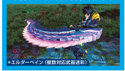
*エルダーペイン(複数対応武器迷彩)

オムニバスクエスト：EPISODE2でも、クエストをクリアすることでさまざまな報酬が手に入る。なかでも注目は、武器迷彩「*エルダーペイン」だろう。大剣だけでなく、長槍・両剣・短杖にも対応しているのでぜひとも手に入れたい。