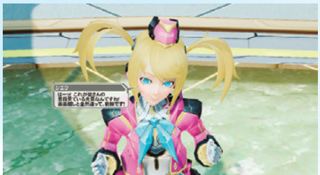
ロビーに外出したシエラの感想は? ▲ずっと艦橋で過ごしていたシエラが初めてアークスロビーに外出。どんな反応を見せるのだろうか。