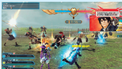
▲バスタークエストもどんどん拡張され、新たな遊びが増えていくようなので期待しましょう。

調整されると発表がありました。どうなっていくのかに注目ですね。そのほかでは、ファクション関連や★14武器といったあたりも票を集めています。安定したサービスの継続の票の多さは、今後の『PSO2』に未永く期待しているというアークスの意思表示のようなもの。開発チームのみなさん、よりよいゲームになるよう開発、がんばってくださいませ！