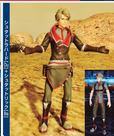
シュタットラハート+シュタットリック [01] [02] [03] [04]