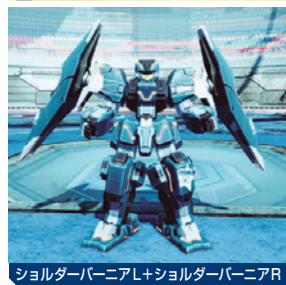
ショルダーバーニアL+ショルダーバーニアR