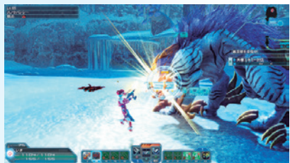
▲クラスバランスの調整は10月下旬を予定。通常攻撃の威力も上がるようで、プレイ感覚も変わりそうです。