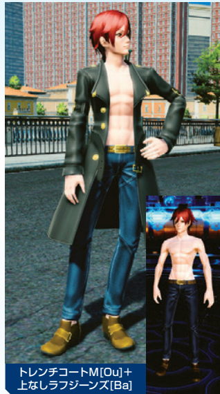
トレンチコートM[Ou]+ 上なしラフジーンズ[Ba]