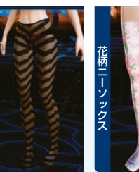
ポーターズストッキング