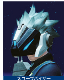
スコープバイザー