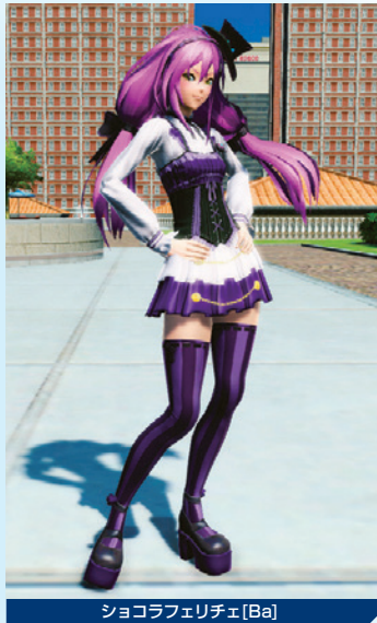
ショコラフェリチェ[Ba]