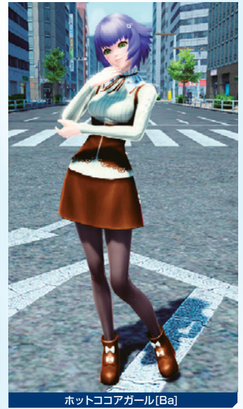
ホットココアガール[Ba]