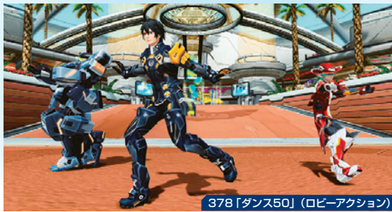
378「ダンス50」(ロビーアクション)