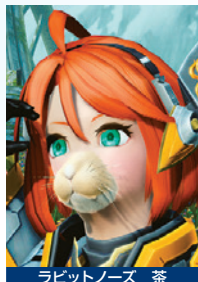
ラビットノーズ 茶