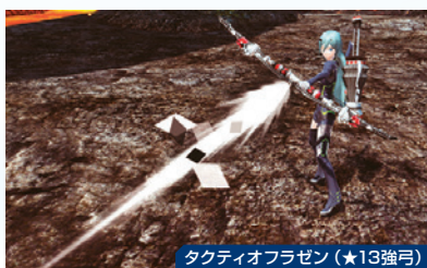
タクティオフラゼン (★13強弓)