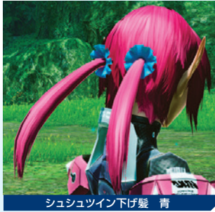
シュシュツイン下げ髪 青

だ。アクセサリでは、エリュトロン・ドラゴンの翼を模したアイテムが登場。ほかにも、最近充実してきた動物系のアクセサリがいくつか追加される。