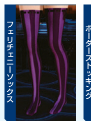
フェリチェニーソックス