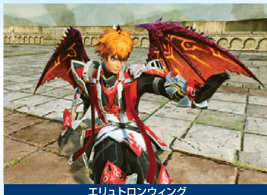
エリュトロンウィング

回答: オークゥとフルのコスチュームについては言わずもがなですが、それ以外にもバレンタインらしいアイテムを取りそろえています。ハートのエフェクトが舞い散る「ラブラーハート」は、ロビアクと組み合わせることでおなじみのポーズやアクションもよりかわいく演出できます。SS撮影にぜひ!