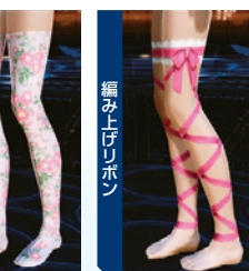
花柄ニーソックス