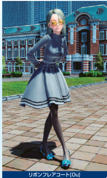
リボンフレアコート[Ou]