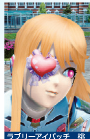
ラブリーアイパッチ 桃