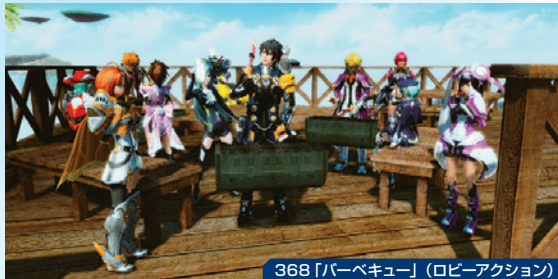
368「バーベキュー」(ロビーアクション)