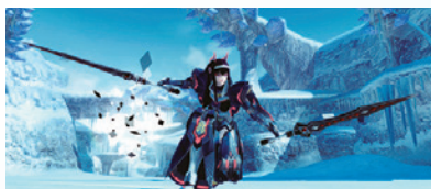
タクティオアンバシア (★13飛翔剣)

コレクトファイル「チョコレートの行方2018コレクション」には、★13武器3種と★13キャンディー1種のシートが存在。いずれも「チョコレートの行方2018」でゲージが伸びやすい。武器はS級特殊能力に対応したタクティオシリーズで、デュアルブレードとバレットボウ、そしてロッドが手に入る。武器自体の攻撃力はバルシリーズと同程度なので、潜在能力や特殊能力因子に期待したい。キャンディーは「ぐんぐんパフェ」という新たなパフェが登場。