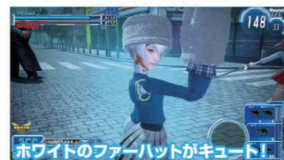
▲白いファーハットがξ988の頭部を暖かく包み込む。これからのシーズンにマッチしたコーディネートだ。