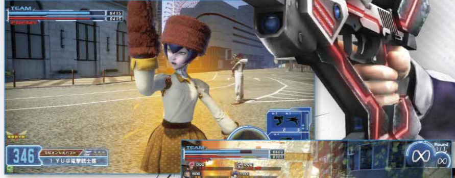
▲追加キャラクターとして登場したξ988と真加部主水のコスチュームが、12月11日のバージョンアップで実装された!