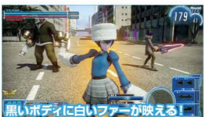
▲第十七極東帝都管理区で着用した場合、ボディカラーが変わると、その印象もガラリと変化しておもしろい。