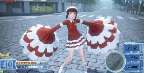
▲季節に合ったコスチュームも登場! クリスマスに合わせてサンタクロース風の衣装のキャンペーンコードをキミはもうゲットしたかな?

国内アーケードゲーム史上最高の賞金総額の公式大会が1月に開催される! まだエントリーのチャンスは残っているのでぜひ参加しよう!