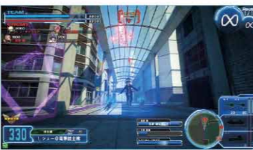
▲屋根のある場所にいると、ロックオンミサイルランチャーやニードルガンのロックオンがされない利点も。

新天地の四隅には屋根のある通路がいくつかあり、ハンドガンやマシンガンなど建物を破壊できない武器であれば防ぐことが可能。しかし袋小路となっているので、ロケットランチャーなどの攻撃範囲の広い武器では、回避が非常に難しい。また⑤～⑥の初期配置下もジャンプするしか逃げ場のない袋小路なので、ジャンプ性能が低く高所に逃げにくいキャラは注意が必要だ。