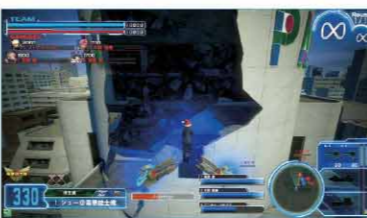
▲本来は①の円筒の周りには登れないが、破壊されると足場となり、ここを起点に屋上へ攻めることが可能。

新天地は、直線上に開けたスペースが多く、着地を狙いやすい。自分をロックオンしている相手を意識して、着地時のスキを建物の陰でカバーすることが大切。また建物が増えると足場が増えることを利用し、壊れた建物で一度ジャンプゲージを回復させるとより回避が安全に行える。任意で建物を破壊することは難しいが、狭い新天地で立ち回るときには重要なテクニックだ。