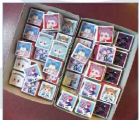
▲交流会参加賞としてプレゼントされたチョコレート。中身は食べちゃいましたが、パッケージは保存していますよ!