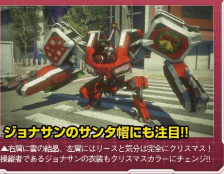
ジョナサンも注目!! ▲右肩に雪の結晶、左肩にはリースと気分は完全にクリスマス! 操縦者であるジョナサンの衣装もクリスマスカラーにチェンジ!!