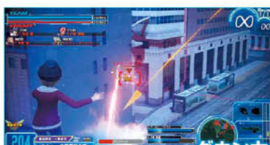
ダウン力の高い武器がそろったWP

を拘束するビームロッドガンを主軸とした近距離での迎撃、足止めが得意。サイドスタイルのビームガトリングガンは、ガトリングガンよりも弾数は少ないが威力のため中距離時の重要なダメージ源となる。また、レミーにしてはコストに対して耐久力が高い。ダウンを奪える能力の高さと持ち前の素早さを活用して、前衛で「暴れまくる」といいたいだろう。