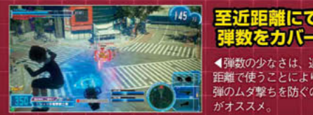
至近距離にて弾数をカバー

ガトリングガンのビーム版で、弾数が非常に少ない反面、高威力。射程は中距離だが、バラまくほど弾数がないため、しっかりと当てる必要がある。またガトリングガンのように建物も壊さないで、建物を貫通して狙えない点も注意。