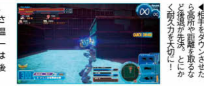
◀相手をダウンさせた後高所や距離を取るとか後退が先決。とにかく耐久力を大切に!

高コストの味方と組む際のコスト調整には最適だが、立ち回りが難しく、耐久力が低いので、一番最初に倒されないようにしたい。中～遠距離主体で戦い耐久力の温存を優先させよう。基本は遠距離武器のホーミングレーザーガンと中距離用のビームマシンガン。素早い敵には命中させやすい前者を。中距離支援には連射力の高い後者と使い分け、味方を援護すること。