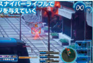
▲一発で約120ダメージをたたき出せる。格闘中や足を止める武器を構えた敵を見逃すな。

近距離での強力なダメージ源が追加されたため、つい前線に出がち。だが基本は高威力のスナイパーライフルで、着地を狙い確実な狙撃をしていくのがオススメ。敵から反撃されにくい遠距離であれば耐久力を残しやすく、勢力ゲージを減らされにくい。ただし最後の敵を倒せば勝ちという優勢の際などは、攻撃を当てやすいショットガンで近距離戦を行うことも大切だ。