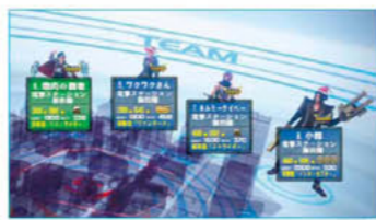
チャンピオン4人で出撃! チャンピオンチームは大阪大会までの期間限定となるよ!

KYS: 4人で割っても75万だしねえ。僕はメイドリフレで使い切っちゃいそうだけど。あは。 KYSさんらしいといえらしいですが……。 インタビューのあと「電撃ステーション 飯田橋」からチャンピオンチームで出撃したり、私とシューくんを交えてバースト(店内同時出撃)をしましたよ!