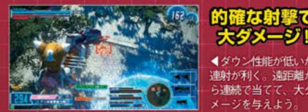
的確な射撃で大ダメージ!

攻撃時にアサルトライフルに近い感覚でズームする中～遠距離向けの武器。威力は低いが、アサルトライフルよりも連射性能に優れており、全弾ヒット時のダメージは高い。