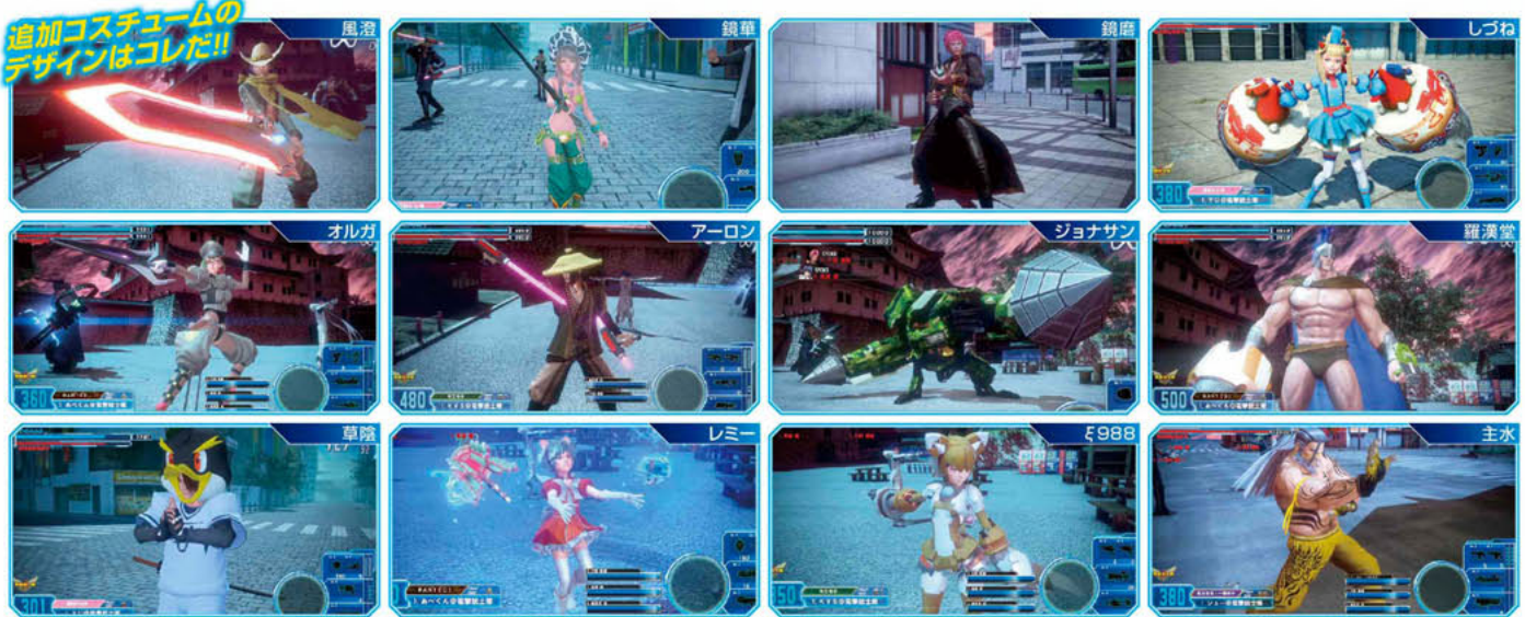
Ver.1.41で追加された購入可能なコスチューム一覧 ※表の部位の列、【頭】は顔部、【上】は上半身、【下】は下半身に装備するコスチュームのことを示す。