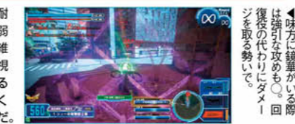
◀味方に鏡華がいる際は強引な攻めも。回復の代わりにダメージを取る勢いで。

攻撃力は高いが、羅漢堂のなかでもコストに対して耐久力が500と少なめ。近距離で立ち回ると撃ち合いの弱さからあっという間に倒されてしまうので、中距離の維持が鉄則。とくに味方に鏡華がいないときはこれを重視したい。ハンドガトリングガンとプラズマ波動砲によるけん制、削りをメインに、とにかく敵から攻撃されにくい位置を確保しながらチャンスを待つ立ち回りが必須だ。