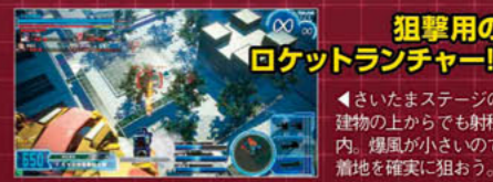
狙撃用のロケットランチャー!!

非常に弾速の速いロケットランチャーという武器で、射程がスナイパーライフルと並ぶほど長い。ロケットランチャーと同様に着弾時に爆風が発生するが、爆風の範囲が狭いので、直撃で大ダメージを与えられる。