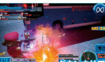
ダウンさせて距離をとりやすくなった!

対処が可能になり、優れた距離を確保しやすくなった。またハンドグレネードも装備しているため、ダウンを狙う武器が複数あるのも特徴。オルガのなかではコストに対して耐久力が高い点も注目したい。反面、ハンドガン以外の武器の弾数が2～3発と非常に少ない。距離に応じてしっかりと使い分け、確実なエイムでダウンを奪うことが前提といえる。