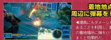
着地点周辺に弾幕を!

一定距離を進むが、着弾時に爆発を起こす弾を連射可能。連射性能が高く、またトリガー引きっぱなしで全弾発射でき弾幕も張れる。爆風にもダメージがあるため、耐久力の少ない敵を倒す際に活用するといいたいだろう。