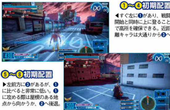
ステージの見方 ①:初期位置 → オススメの進軍ルート ①:攻略ポイント