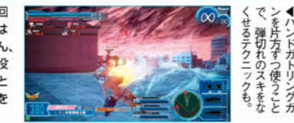
◀ハンドガトリングガンを片方ずつ使うことで、弾切れのスキをなくせるテクニックも。

バージョンアップにより、回復ライフル持ち同士の回復量が減少。そのため、鏡華同士のチームになった際はアタッカーとして重宝する。シールド系武器がないぶん、耐久力も高めなので、最前線で敵のターゲットを集め役も兼ねて攻撃しよう。メインのハンドガトリングガンとアサルトライフルのリロードがやや長め。両方の武器を使い分け、攻撃できない状況を作り出さないように。