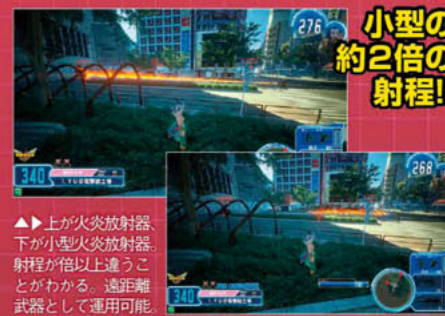
小型の約2倍の射程!!

性能は小型火炎放射器と似た炎を放射し続ける武器。また射程が小型火炎放射器の約2倍ある。通常の弾やビームと異なり、攻撃判定が非常に大きく、当たり判定の小さな敵でも比較的当てやすい。弾数はプラズマ波動砲と同様に放射している間だけ減少。弾数を残して追撃できないことがないように使い切ってからリロードするように。