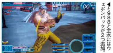
▲Ver.1.41ではウェポンパックが追加された

ここでは、1月31日のバージョンアップで追加された武器に関する情報をまとめ、各キャラクターの新ウェポンパックのデータを掲載するほか、攻略班が注目するウェポンパックを解説。さらに5つの新武器の性能もチェックだ。