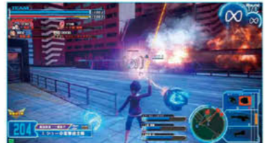
▲鉄球ハンマーガンはロックが赤の際に撃てば少しだけ誘導する。連射性能が低さは正確なエイムで勝負！

立ち回りは、ビームロッドガンで敵を拘束した後に鉄球ハンマーガンでビームガトリングガンで追撃するのがセオリー。ただしビームガトリングガンは弾数が少ないので、基本は鉄球ハンマーガンを主軸に近～中距離でダウンを奪っていく。また敵に遠距離武器を持つキャラがいなければ反物質ミサイルランチャーを使うのを忘れずに。全体的な弾数の少なさをこの武器の威力で補おう。