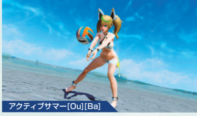
アクティブサマー[Ou][Ba]