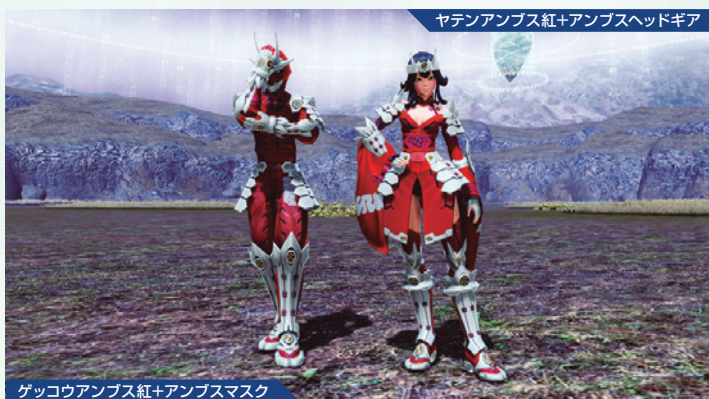
ゲッコウアンブス紅+アンブスマスク