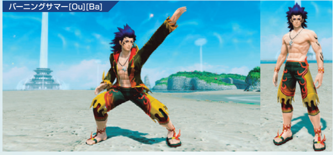
バーニングサマー[Ou][Ba]