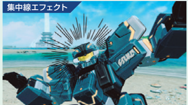
集中線エフェクト