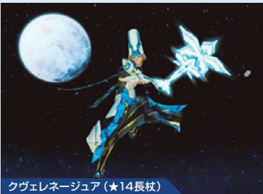
クヴェレネージュア(★14長杖)