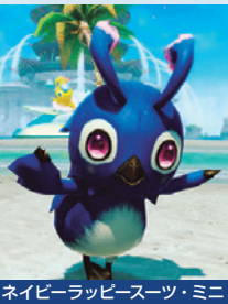
ネイビーラッピースーツ・ミニ

「Eトリアル」は、昨年同様、二手に分かれて進行。出現ではLv.85のボスが出現する。XH