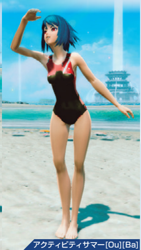
アクティビティサマー[Ou][Ba]