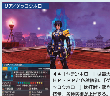
リア/ゲッコウホロー

バトルコイン交換ショップのラインナップが一新。限定アイテムのカプキシリーズが交換終了となり、忍者をイメージしたデザインのコスチュームやロビアクアクションが追加される。コスチュームカラーはこれまでどおり、赤系と青系の2種類。アクセサリーはコスチュームとカラーが同期するタイプになっている。