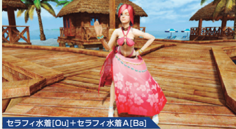
セラフィ水着[Ou]+セラフィ水着A[Ba]