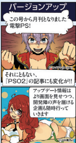
バージョンアップ